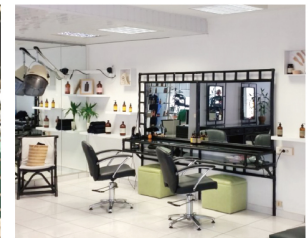
NEW CALEDONIA ニューカレドニア店

20 rue Jean Jaurès 98800 Nouméa New Caledonia