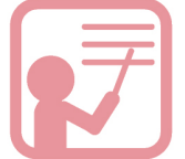
専属教育担当者が育成