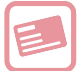
社会保険完備 (健康保険・厚生年金)