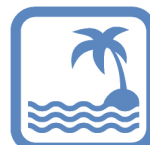
バカンス制度 (10連休)