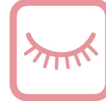
オプション教育 メイク・着付けなど